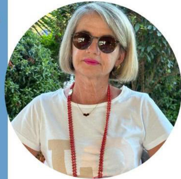
Michela Acconci Scuola Primaria

Ecco il perché della mia candidatura e la scelta di questo Sindacato che ha fatto proprie le lotte per una SCUOLA DEMOCRATICA, LIBERA che sappia dare dignità' alla professione degli insegnanti e che passi anche da una " giusta" riqualificazione economica.