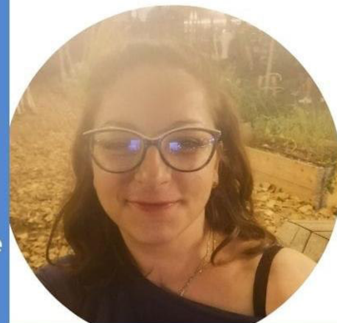
MARIAPINA BALESTRA SCUOLA SECONDARIA DI PRIMO GRADO

È necessario che la scuola riprenda la sua centralità nella società contemporanea e che riacquisti il suo valore. Noi ci impegniamo perché ciò avvenga.